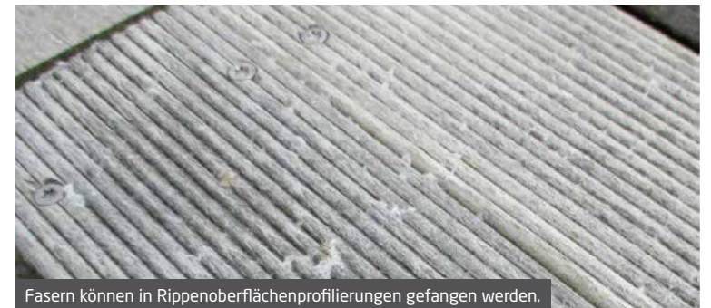
Fasern können in Rippenoberflächenprofilierungen gefangen werden.

In all diesen Fällen ist die Haltbarkeit des Accoya® Holzes in keiner Weise beeinträchtigt. Jedoch empfiehlt es sich, regelmäßig alle losen Fasern zu entfernen, da diese sich an einem Ort sammeln, wo sich dann Organismen niederlassen, was zur Verunstaltung des Holzes führen kann.