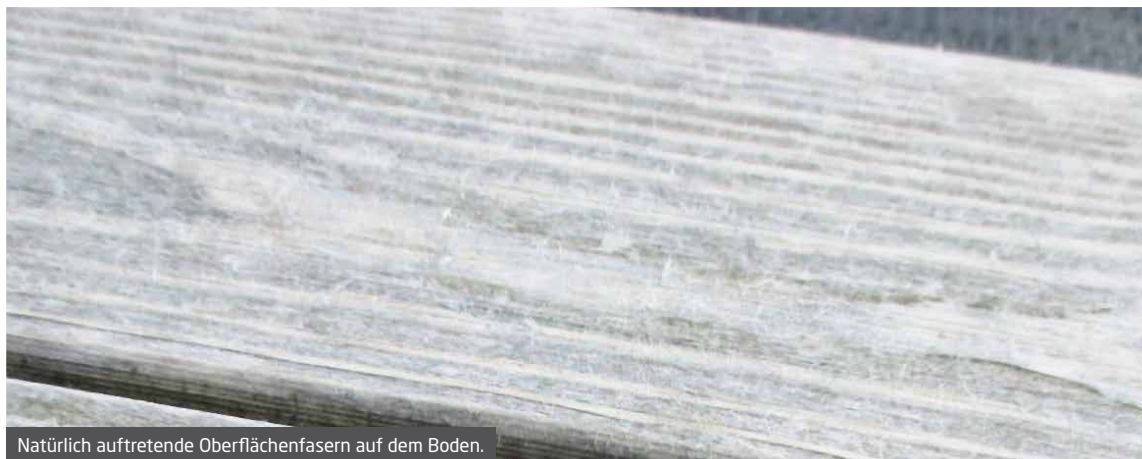
Natürlich auftretende Oberflächenfasern auf dem Boden.

Je höher die Menge oder die Intensität der UV-Oberfläche ist, desto schneller entwickelt sich dieser Prozess. Es ist anzumerken, dass diese Fasern auf allen exponierten Holzarten, einschließlich Accoya®, insbesondere auf flachen Oberflächen, wie Böden gebildet werden. Ein geripptes Bodenprofil neigt dazu, diese Fasern anzusammeln, was es umso auffälliger macht.