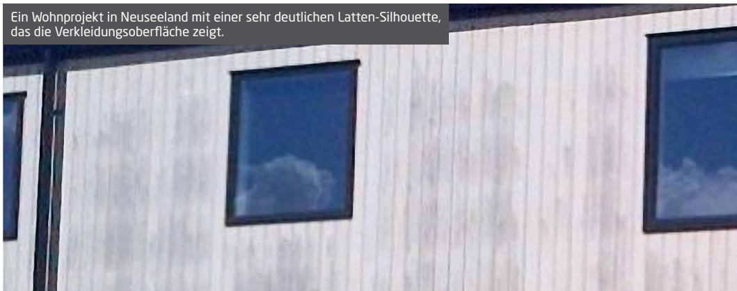
Ein Wohnprojekt in Neuseeland mit einer sehr deutlichen Latten-Silhouette, das die Verkleidungsfläche zeigt.

Weitere Informationen zur Bodenreinigung erhalten Sie bei Ihrem zuständigen Vertriebsmitarbeiter.