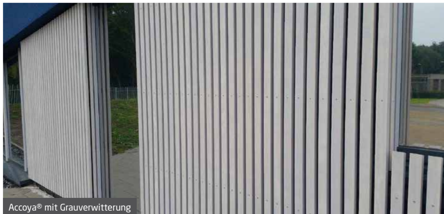
Accoya® mit Grauverwitterung

Eine weitere Maßnahme, um das Risiko von Schimmel/Hefewachstum auf und durch die Beschichtungen zu verringern, ist die Verwendung einer dickeren Schicht, da diese die Feuchtigkeitsabsorption verringert. Diese filmbildenden Beschichtungen sind typischerweise für Verkleidungen geeignet.