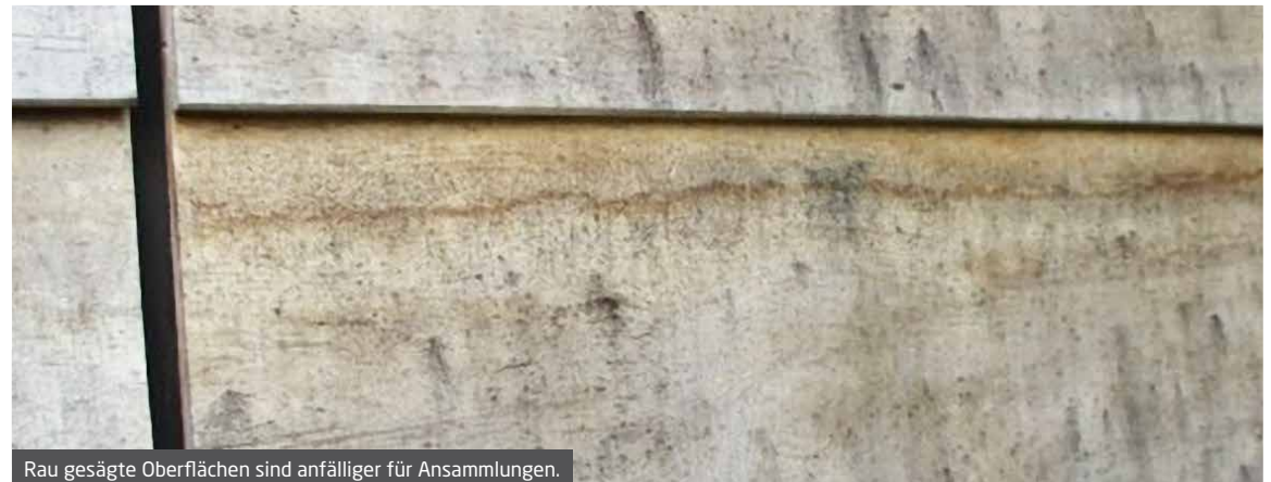
Rau gesägte Oberflächen sind anfälliger für Ansammlungen.

Während diese Oberflächenwucherungen nicht selbst zum Verfall führen, sind sie oft mit dem Beginn des Pilzverfalls von Holz verbunden. Auf der ungiftigen Oberfläche von Accoya® kann Schimmel wachsen, aber die Fäule, die die Unversehrtheit des Accoya® beeinflussen könnte, beginnt damit nicht.