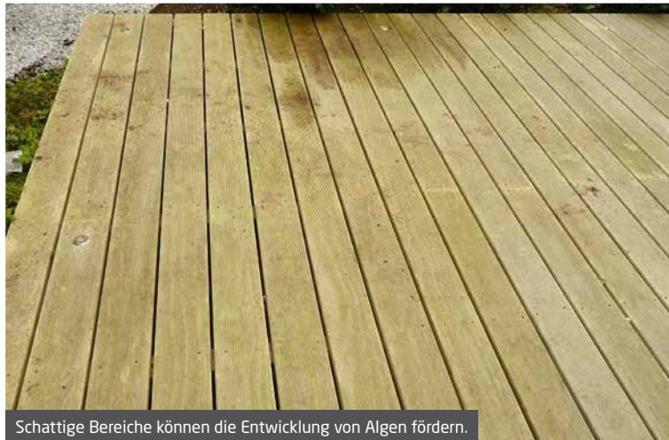
Schattige Bereiche können die Entwicklung von Algen fördern.

Dies wird nicht nur auf der Oberfläche beim Trocknen sichtbar, sondern hat auch einen Einfluss auf die Entwicklung von Schimmelpilzen, Algen und so weiter.